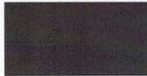
Michal Malář vedoucí odboru správy majetku