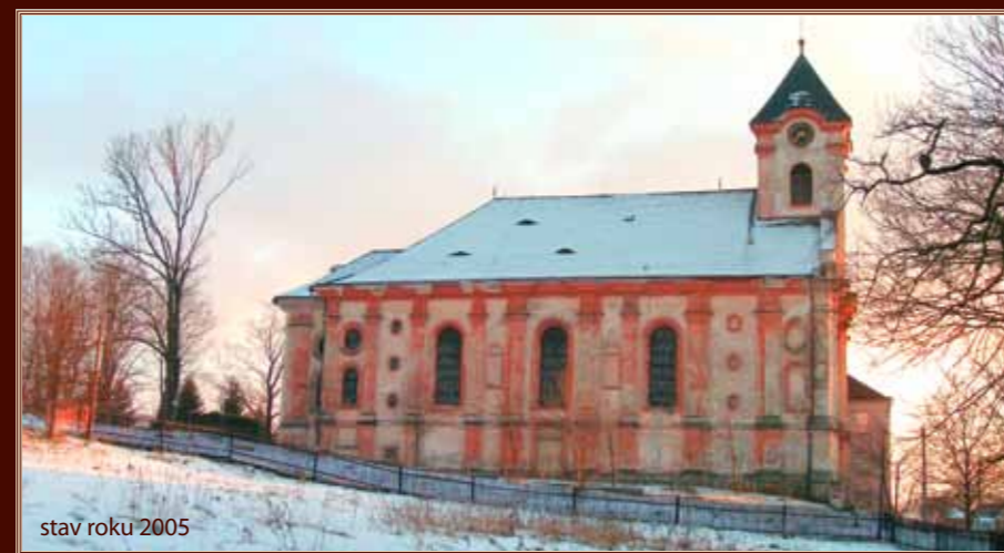
stav roku 2005

Na přelomu století byl kostel ve velice zanedbaném stavu, zatékalo do něj a vnější omítky opadávaly i s kusy zdiva. Jelikož nebylo v silách chodovské římsko-katolické farnosti zajistit potřebné finance na jeho generální opravu, došlo v závěru roku 2005 k dohodě, na jejímž základě byl kostel sv. Vavřince převeden do majetku města Chodov. Město Chodov realizovalo rozsáhlou opravu kostela od května do listopadu roku 2006. Při ní byla zejména