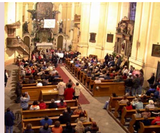
Koncert v kostele

Po druhé světové válce a vysídlení původního německého obyvatelstva začal kostel rychle chátrat a koncem 60. let byl v katastrofálním stavu. Společně s výstavbou panelových domů v ulici pod kostelem se dalo znovu do pohybu podloží a kostel začal hrozit zřícením. V sedmdesátých letech proběhla nákladná rekonstrukce a pilotáž kostela, která sice zachovala stavbu, ale poškodila vnitřní vybavení budovy.