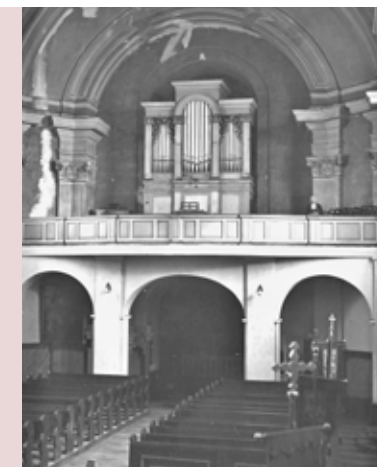
Pohled na varhany 1944