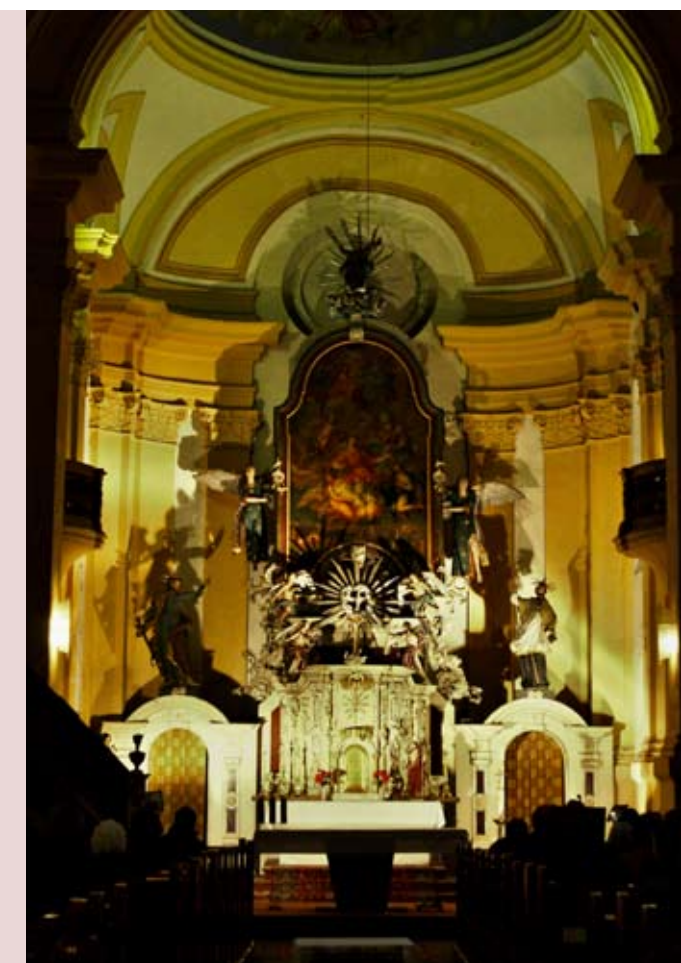
Oltář s obrazem sv. Vavřince

Na přelomu milénia byl kostel ve velice zanedbaném stavu, zatékalo do něj a vnější omítky opadávaly i s kusy zdiva. Jelikož nebylo v silách chodovské římsko-katolické farnosti zajistit potřebné finance na jeho generální opravu, došlo v závěru roku 2005 k dohodě, na jejímž základě byl kostel sv. Vavřince převeden do majetku města Chodov. Město Chodov realizovalo rozsáhlou opravu kostela od května do listopadu roku 2006. Při ní byla zejména rekonstruována střecha, byly opraveny vnější omítky, vitráže oken a kamenné prvky, včetně vstupního schodiště a také byly vyměněny či repasovány všechny dveře.