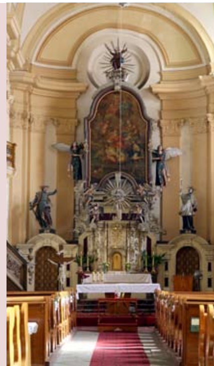
Hlavní oltář

Umělecky nejzajímavějším prvkem celého hlavního oltáře je ústřední obraz umučení sv. Vavřince. Starší oltářní plátno bylo nejspíše regionální prací, která byla počátkem 19. století v tak špatném stavu, že byla při tvorbě nového oltáře nahrazena novým obrazem z dílny Mauruse Fuchse z Tirschenreuthu. Rozměrný a velmi hodnotný obraz představuje smrt svatého Vavřince a jeho přijetí mezi svaté. V centru malby je nadnášen anděl samotný světec, jehož v nebesích vítá svatý Sixtus II. - papež, který zemřel mučednickou smrtí jen pár dní před Vavřincem. V horní části je pak Svatá Trojice - otec, syn a duch svatý. V levém dolním rohu obrazu je pak scéna umučení svatého Vavřince, který byl římskými vojáky upálen na roštu.