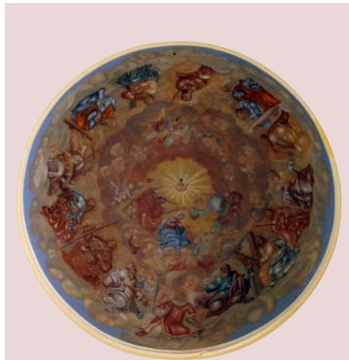
Freska v klenbě